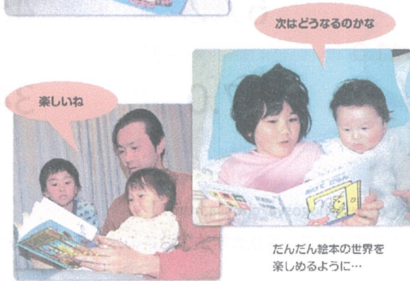
だんだん絵本の世界を楽しめるように...